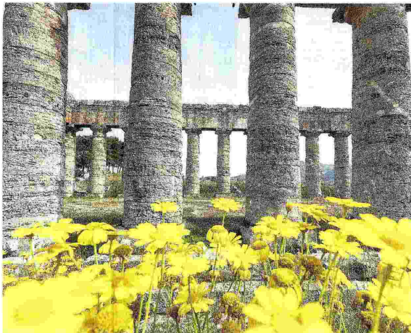
Il tempio di Segesta. L'Italia è un museo diffuso, dall'Alto Adige alla Sicilia