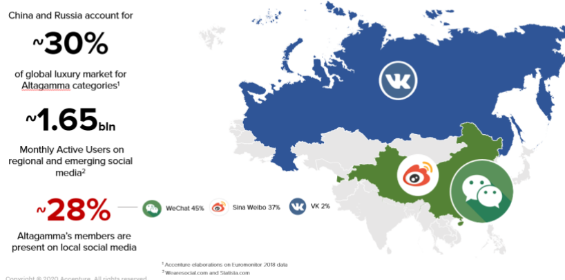
Figura 3: Social Luxury Index, clicca qui per scaricare l'opportunità negli emerging social

L'analisi di Accenture e Altagamma focalizza infine l'attenzione sul legame esistente tra i brand del lusso e il concetto di Made in Italy: sebbene infatti il patrimonio di valori legati al marchio del Bel Paese sia implicitamente comunicato in molti prodotti dell'industria del lusso, a fare leva in maniera diretta anche sui canali social proprio su questo punto di forza sono maggiormente Nautica (95%) e Design d'interni (43%) .