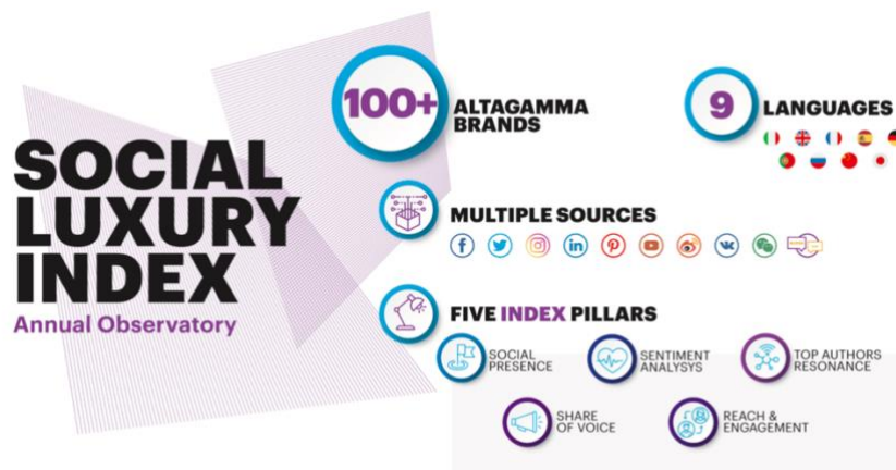
Figura 1: Social Luxury Index, clicca qui per scaricare l'infografica

Il rapporto ha preso in esame le conversazioni spontanee inerenti al Luxury - Made in Italy sui canali social per un intero anno: un mondo, quello dei social, a cui le nostre eccellenze si affacciano con gradi diversi di maturità. Il Social Luxury Index servirà come parametro sintetico di riferimento per misurare l'andamento delle strategie social dei brand sotto vari punti di vista: presenza geografica, share of voice, sentiment delle conversazioni, coinvolgimento delle persone e di eventuali ambassador .